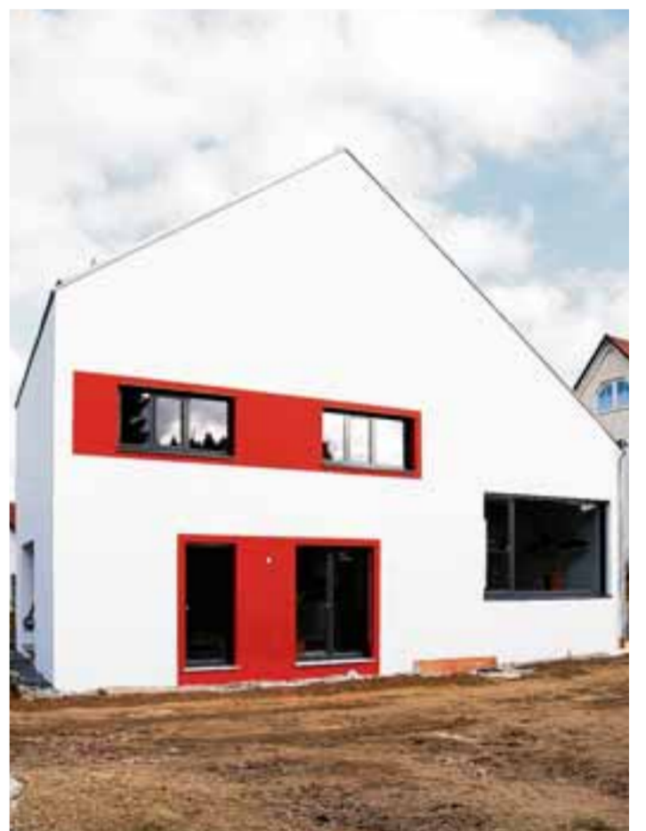
Mit Fördermaßnahmen und einem finanziellen Grundstock lässt sich ein Eigenheim zeitnah realisieren.

Wem dies alles zu kompliziert ist, wer über keinen Zugang zum Internet verfügt oder einfach einmal einen ersten Einstieg ins Thema sucht, der kann sich unter der kostenfreien Telefonnummer 08000-736734 der dena informieren lassen. Lohnenswert ist auch eine Baufinanzierungsberatung bei einer Verbraucherberatung. Dort kann man sich sicher sein, neutrale Informationen zu erhalten, was bei Banken nahezu unmöglich ist.