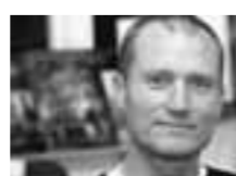
Frank Kühne Architekt

Beratung - Entwurf - Genehmigungsplanung Bauleitung - Neubau - Gewerbebau - Sanierung Umbau - Nutzungsänderung - Denkmalpflege